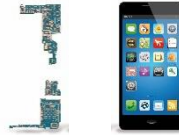
Leiterplatten für mobile Endgeräte